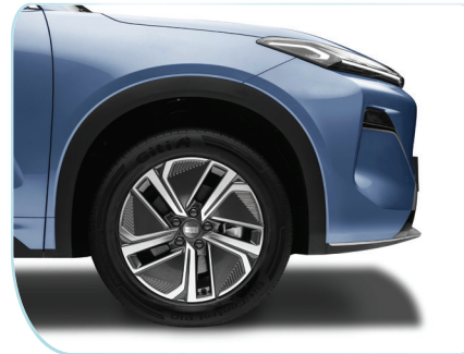
La-zăng khí động học, kích thước 18 inch.