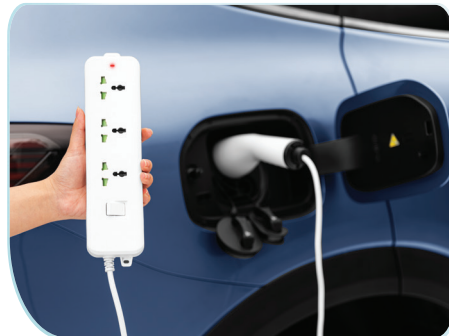
Chế độ Camping tích hợp chức năng Vehicle to Load (V2L), Vehicle to Vehicle (V2V) thời thượng.