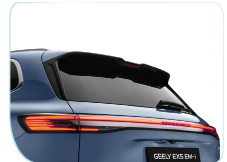
Cánh lướt gió khí động học kết hợp cùng dải đèn LED kéo dài tinh xảo.