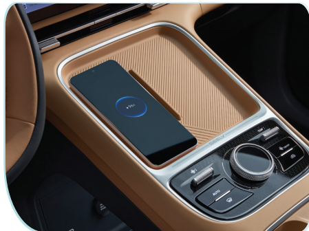
Sạc điện thoại không dây tiện lợi.