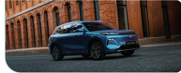
Vận hành thuần điện (BEV), đem lại cảm giác êm ái, thoải mái.