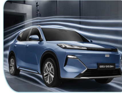
Sở hữu hệ số cản gió chỉ 0,288 Cd, giúp tối ưu vận hành và gia tăng quãng đường di chuyển.