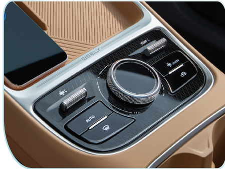
Tích hợp nút bấm vật lý, mang đến trải nghiệm trực quan, dễ thao tác.