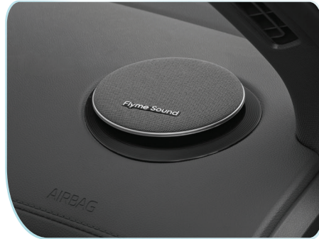
Âm thanh Flyme Sound 16 loa công suất 1.000 W sống động, cá nhân hoá vùng nghe cho người lái.