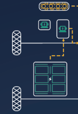
Chế độ Hybrid song song (Parallel Boosting Mode)

Hoạt động: Động cơ xăng khởi động nhưng chỉ đóng vai trò máy phát điện để sạc pin hoặc cấp điện cho mô-tơ lái.