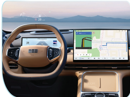
Head-Up Display (HUD) kích thước 13,8 inch hiển thị thông tin trực quan, hạn chế tối đa sự xao nhãng khi lái xe.