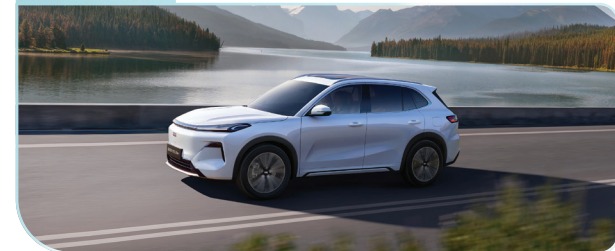
Sử dụng đồng thời cả động cơ xăng và mô-tơ điện nhằm đem lại hiệu suất vận hành cao hơn.