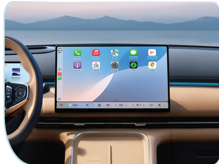
Hệ điều hành Flyme Auto thông minh kết hợp với màn hình 15,4 inch, có thể điều khiển bằng giọng nói, thao tác rảnh tay an toàn.