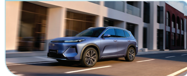
Kết hợp giữa động cơ xăng và mô-tơ điện, pin được sạc thông qua máy xăng hoặc phanh tái sinh.