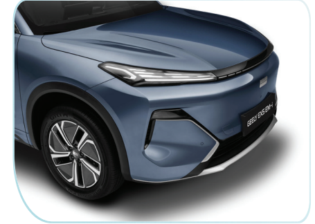
Thiết kế tổng thể cao và rộng, kết hợp các đường thẳng đứng dứt khoát, mang đến cảm giác đồ sộ và sang trọng.