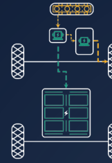
Chế độ Hybrid nối tiếp (Series Charging Mode)

Mở ra kỷ nguyên di chuyển thể hệ mới, mang đến trải nghiệm lái mượt mà như xe thuần điện (EV) với khả năng vận hành linh hoạt, giảm phát thải và quãng đường di chuyển vượt trội.