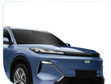
Cụm đèn trước tách rời, được tạo hình tinh xảo, cho tầm chiếu xa tối đa 181 m và vùng sáng rộng lên tới 23 m.