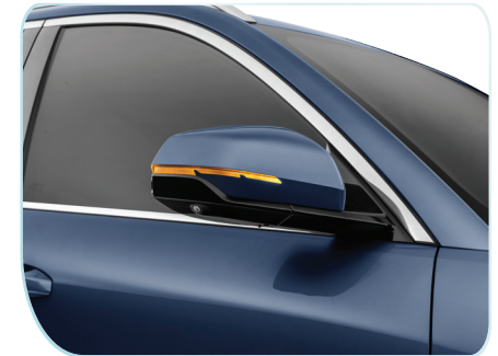
Gương chiếu hậu tích hợp đèn báo rẽ, chỉnh điện, sấy gương và cảnh báo điểm mù (BSD).